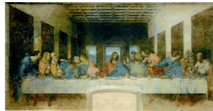
レオナルド・ダ・ヴィンチ作 「最後の晩餐」世界文化遺産